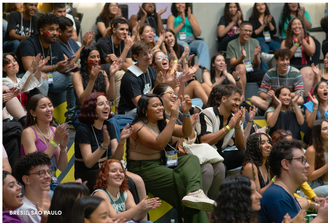
BRÉSIL, SÃO PAULO