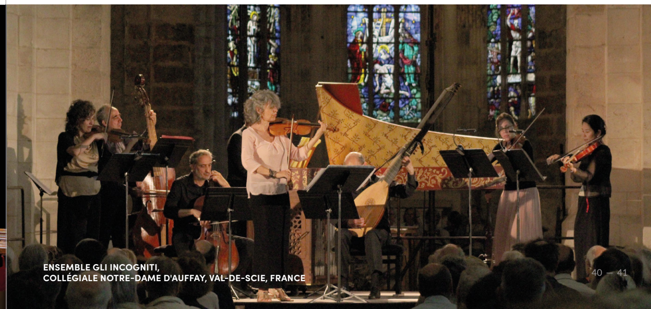
ENSEMBLE GLI INCOGNITI, COLLÉGIALE NOTRE-DAME D'AUFFAY, VAL-DE-SCIE, FRANCE

24 communes de la Seine-Maritime et de l'Eure