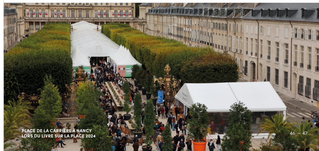
PLACE DE LA CARRIÈRE À NANCY LORS DU LIVRE SUR LA PLACE 2024