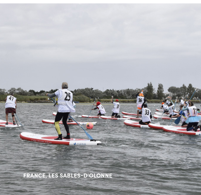
FRANCE, LES SABLES-D'OLONNE