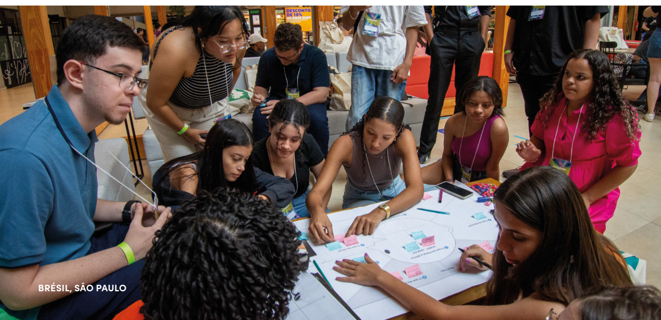
BRÉSIL, SÃO PAULO