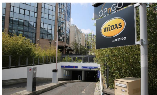
Entrée du parking Indigo Place Abel Gance

Ce parking de Boulogne n'a par ailleurs pas été choisi par hasard puisqu'il est en effet implanté dans un quartier d'affaires stratégique . Sur trois niveaux, il propose un total de 525 places (dont près de 400 abonnés) et abrite pour 75% des voitures de société. De grandes entreprises telles que TF1, Canal+ ou encore France Galop sont situées juste au dessus de celui-ci et mettent de nombreuses voitures à disposition de leurs collaborateurs. Autant d'opportunités de fidélisation à ce service innovant et gage d'utilité pour les utilisateurs Indigo .